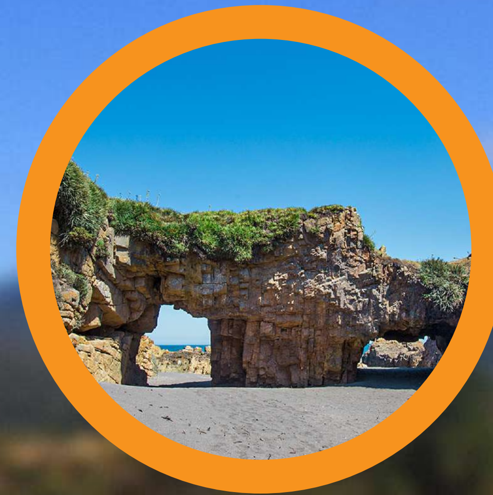
ARCOS DE CALÁN