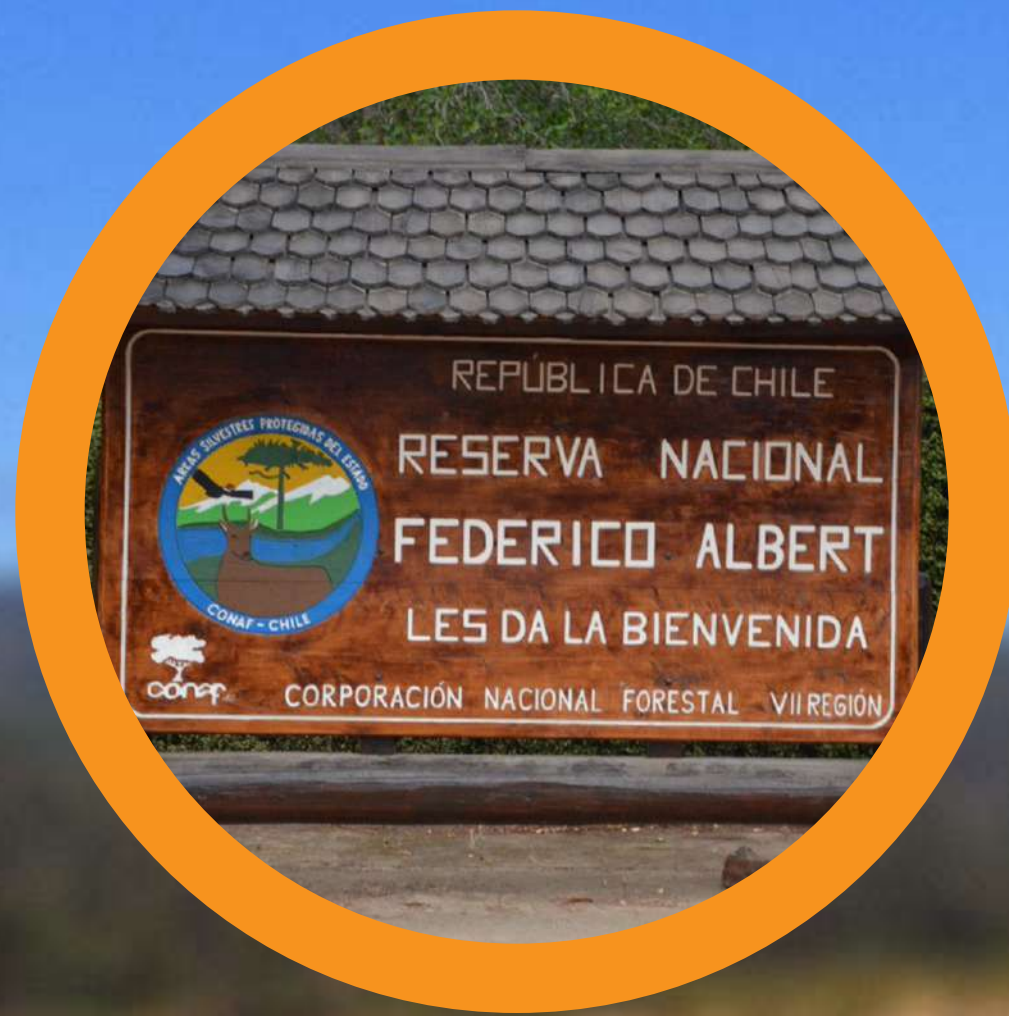
RESERVA NACIONAL FEDERICO ALBERT