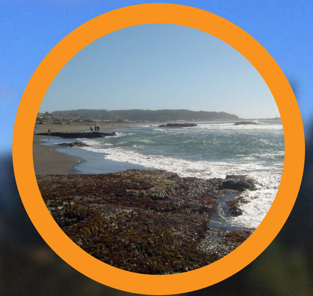
PLAYA TRES PEÑAS