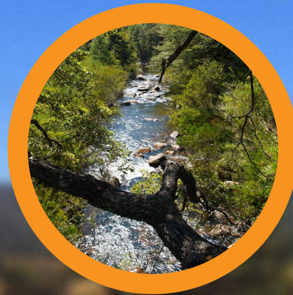
RESERVA NACIONAL LOS RUILES